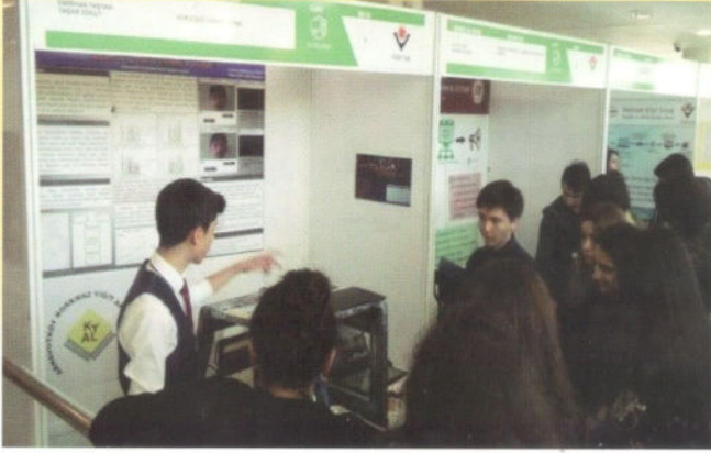
İstanbul Avrupa Bölgesi