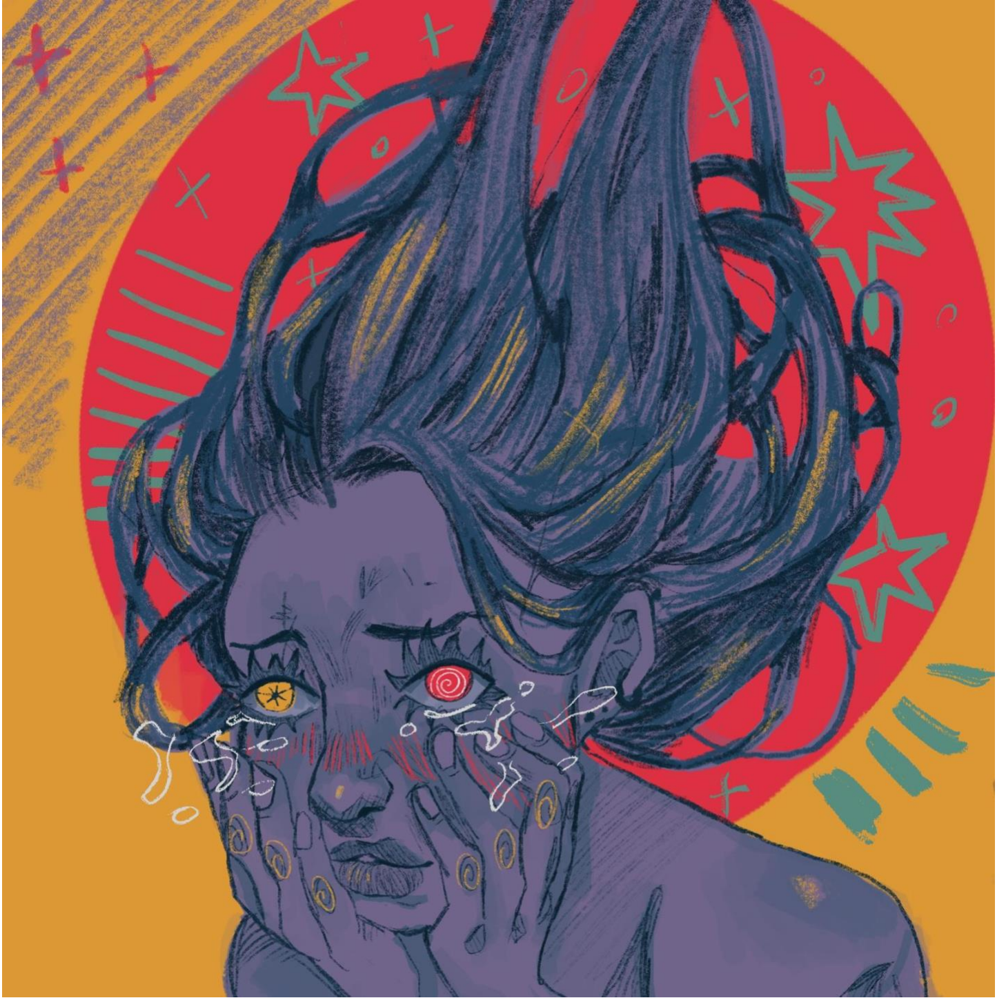
(Beren Naz Dağdelen)