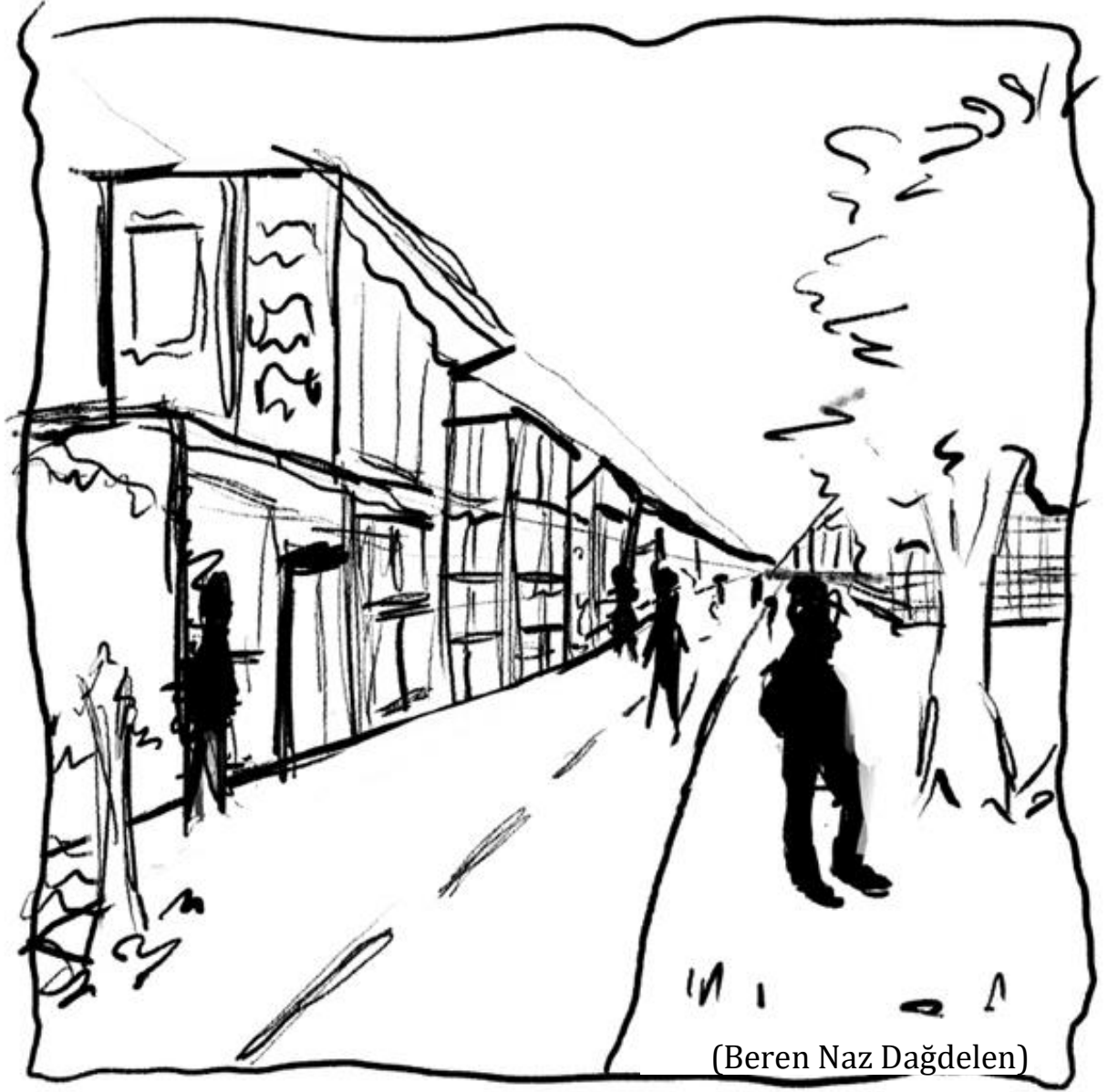
Arnavutköy Korkmaz Yiğit Anadolu Lisesi