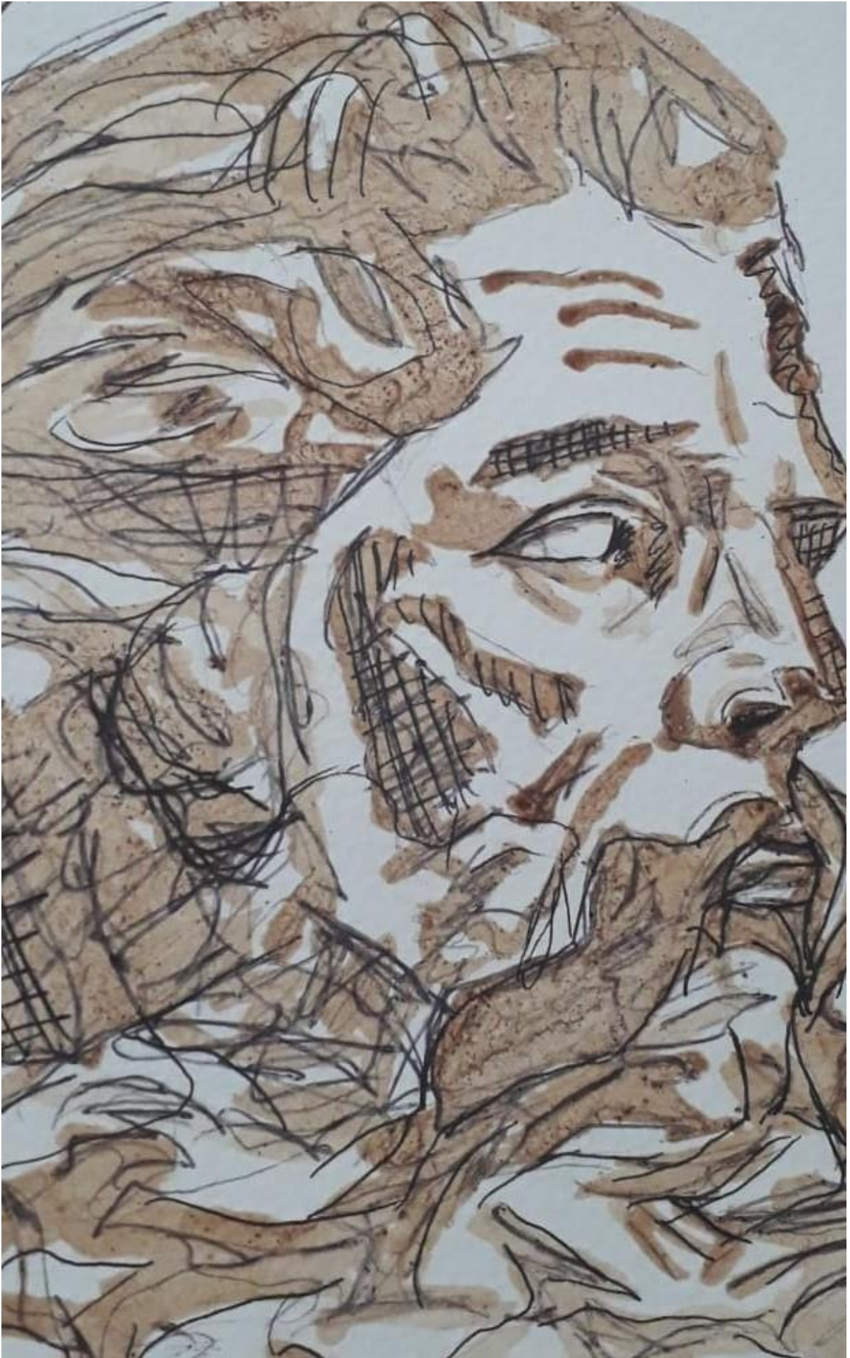
(Reyyan Kılıç, 2021)